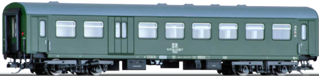
Abbildung zeigt Art. 16602

Art.-Nr. 16600 • 16601 • 16602 • 291339 (für Set 01660)