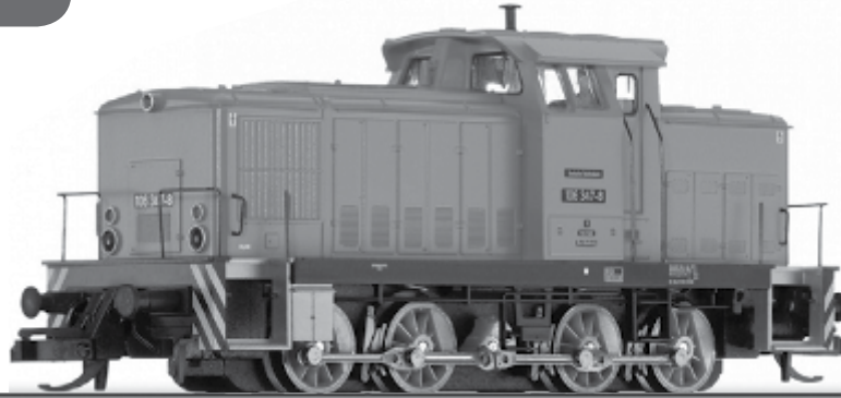
Abbildung zeigt Art.-Nr. 96151

Art.-Nr. 96151 • 96154 96155 • 96156 96157 • 96158 96159